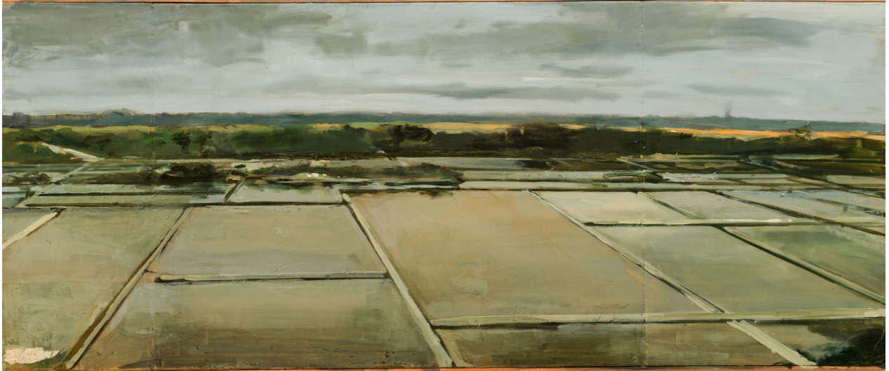
© Alex Amann 2013, 2015, 60,5 x 146 cm