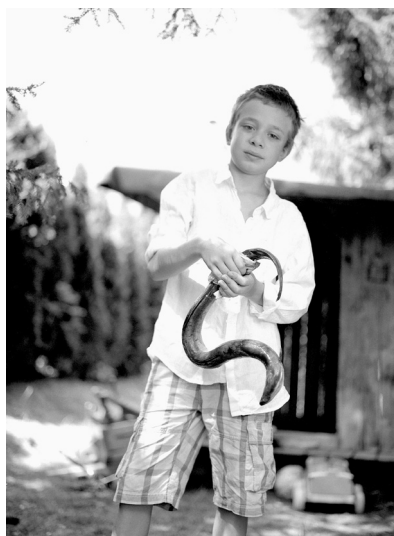
© Ralf Marsault Zeno, Nötsch 2013, 30 x 40 cm, Silver Gelatin Print on Baryta Paper expo