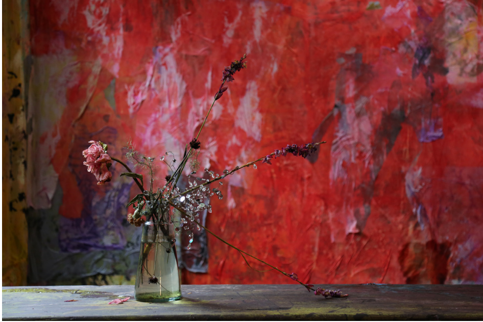
© Ralf Marsault Féral III, Berlin Kreuzdorf 2016, 80 x 120 cm, Chromogenic Print Super Glossy Premium Expo