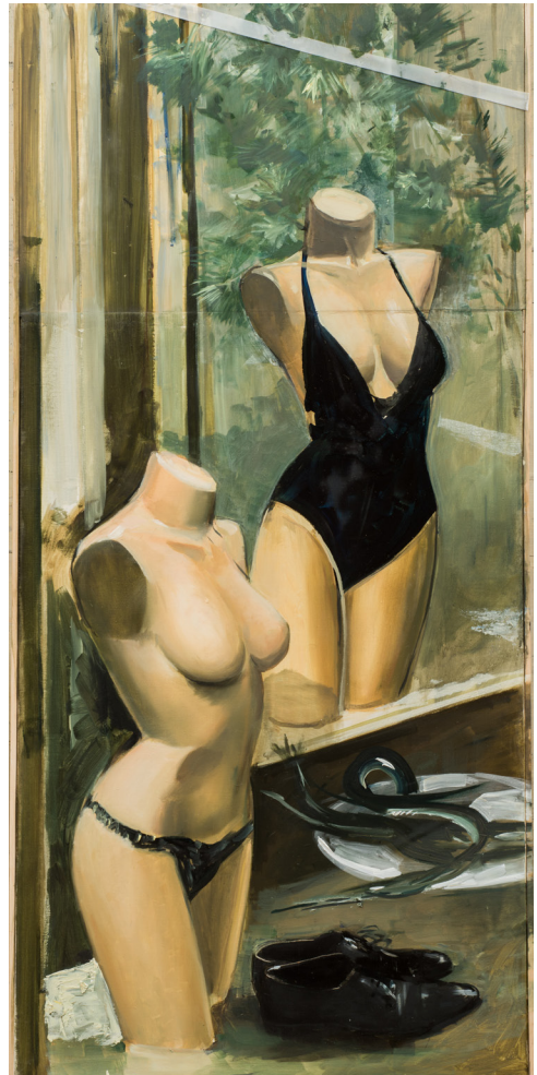
Alex Amann 2017, 141,5 x 67 Huile sur bois 2017