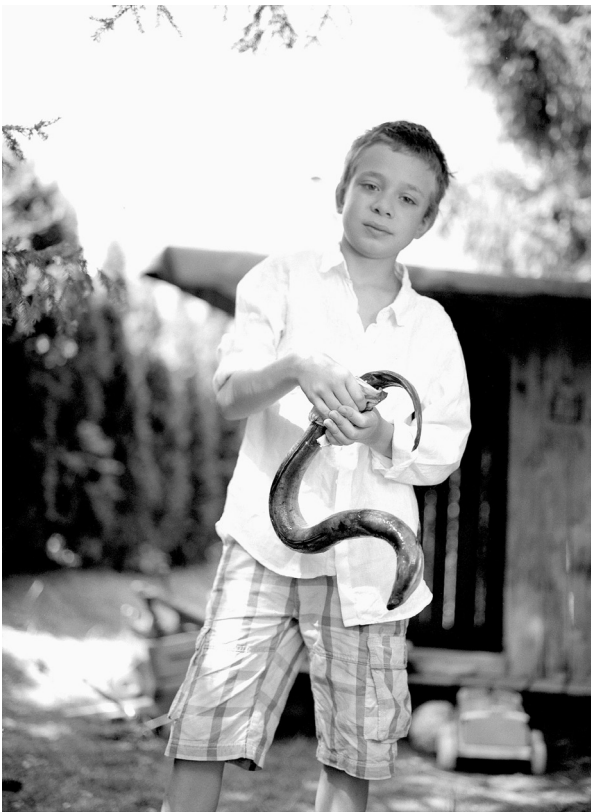
© Ralf Marsault Zeno, Nötsch 2013, 30 x 40 cm, Silver Gelatin Print on Baryta Paper expo