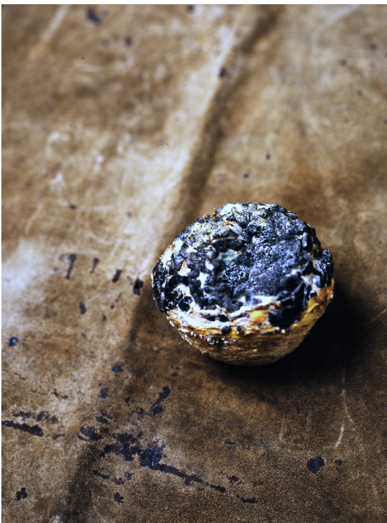
© Ralf Marsault Bewegtes Leben III, Berlin 2011, 60x90 cm, Chromogenic Print Super Glossy Premium Expo