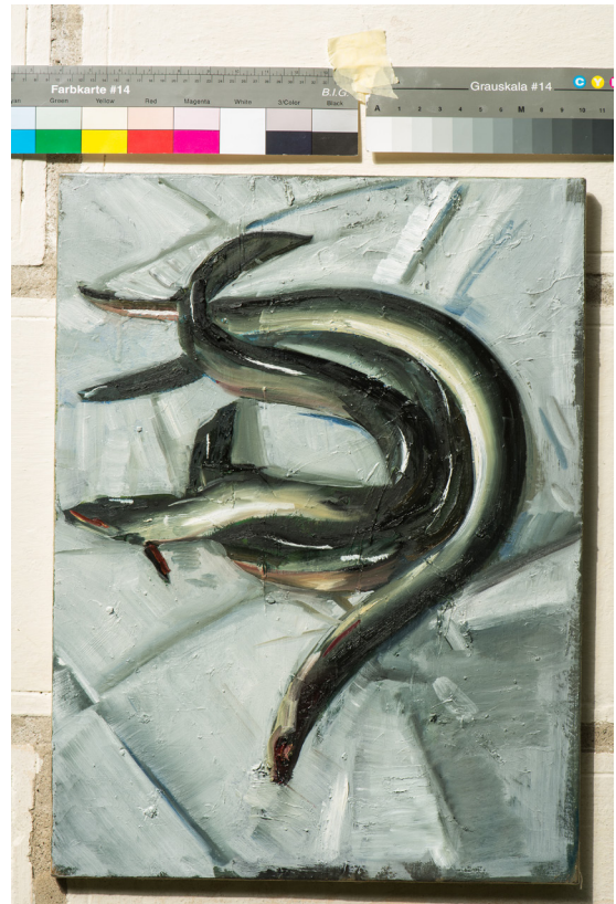
© Alex Amann 2012, 61 x 45 cm