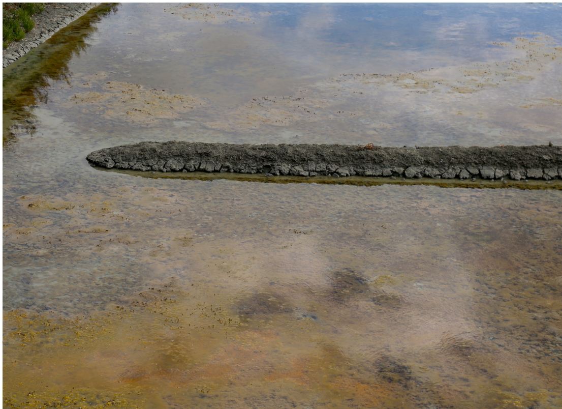
© Ralf Marsault Jetée, Batz Mer 2017, 60 x 80 cm, Chromogenic Print Super Glossy Premium Expo