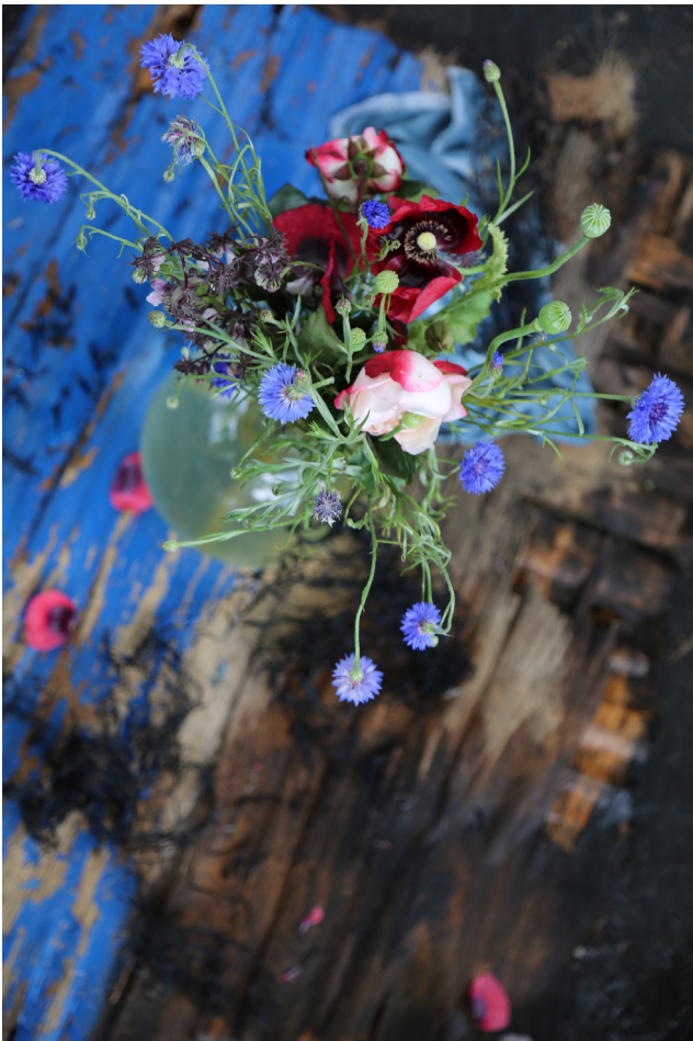
© Ralf Marsault Another Constellation III, Berlin Kreuzdorf 2016, 50 x 60 cm, Chromogenic Print Super Glossy Premium Expo