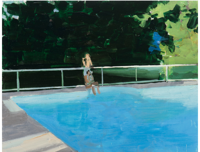
© Alex Amann 2017, Huile sur toile 35x45cm