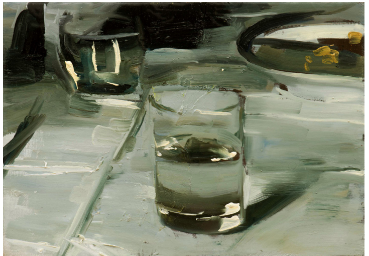
Alex Amann 2017, Huile sur toile 25 x 35 cm ©Ferdinand Neumüller