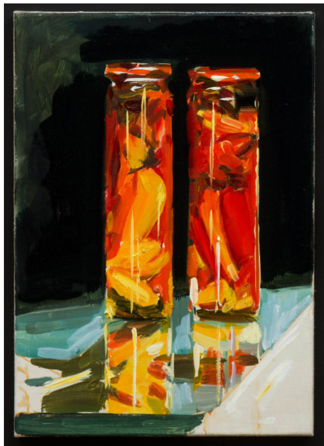
© Alex Amann 2016, Huile sur toile 45 x 32 cm